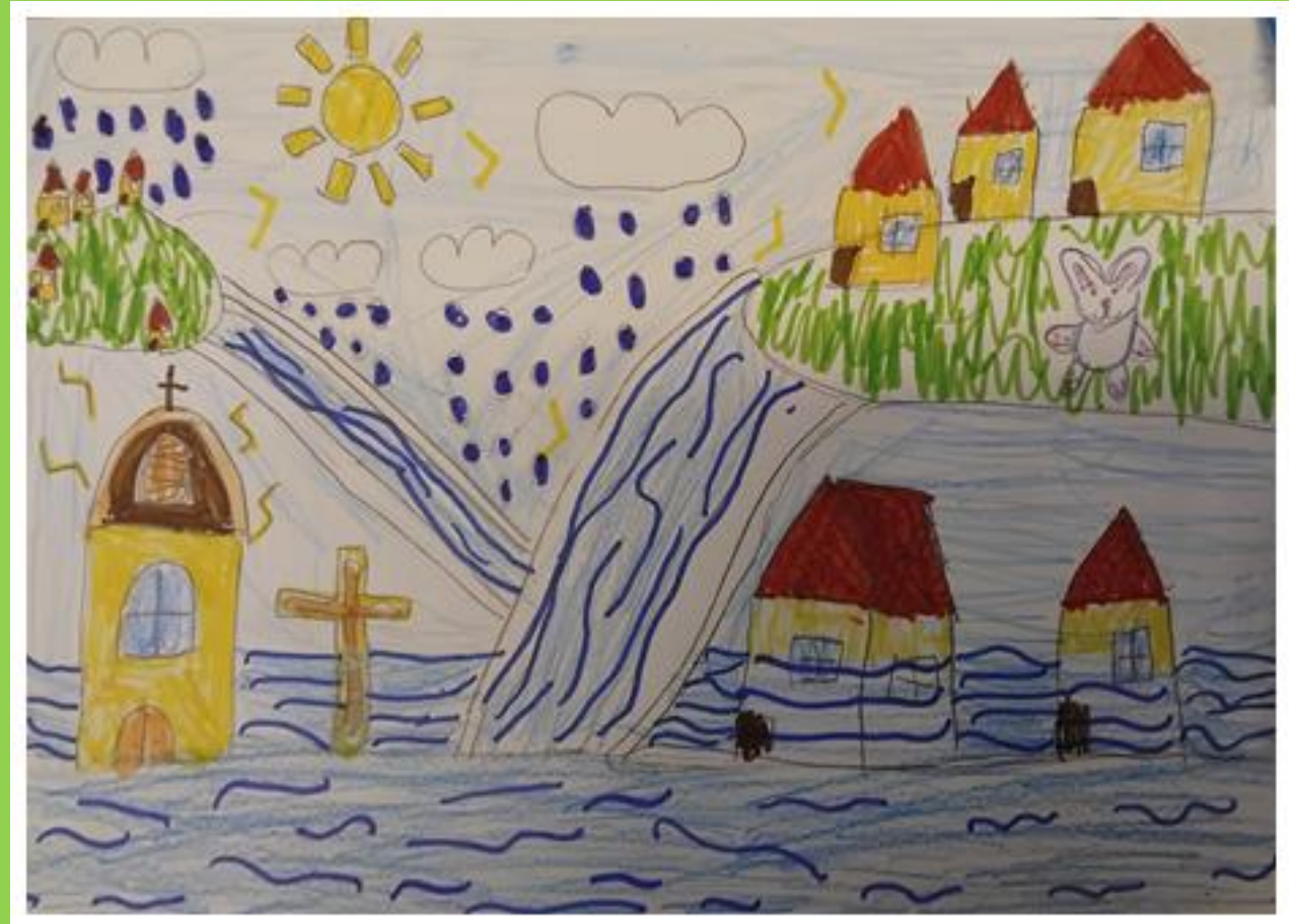
Gyermekrajz az elöntött faluról

Ebből is harag lett, a lenti emberek Szidalmazni kezdték a hegybelieket: -Micsoda dolog ez, még ilyet ki látott, A püspökhöz mentek, tegyen igazságot.